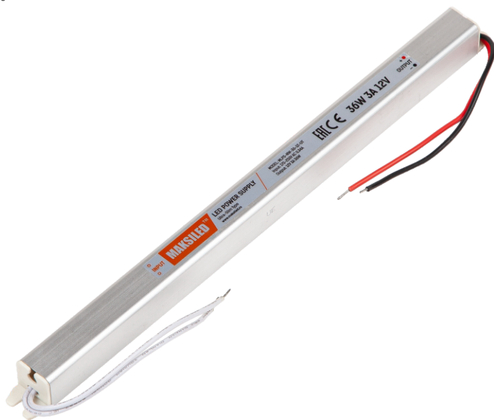
Модель: MLPS-NW-36-12-UT Размеры: 283*18*18 мм MLPS-NW-36-24-UT